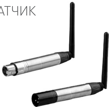
Female / Male